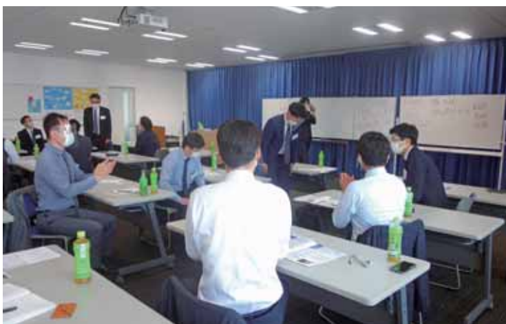
グループワーク、発表の様子